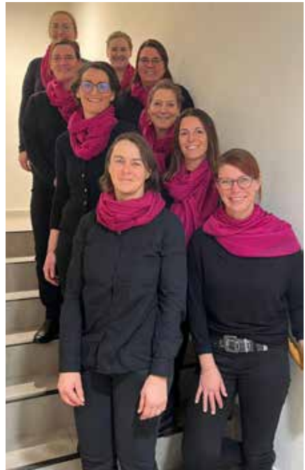
Damenchor „Glückklang“, der die Veranstaltung musikalisch umrahmte.

Die Weihnachtsfeier zog nicht nur IPA-Mitglieder an, sondern auch Vertreter aus anderen gesellschaftlichen Bereichen der Gemeinde. Auch Freunde der Landesgruppe Salzburg sowie der Verbindungsstelle Rosenheim fanden den Weg nach Ainring. Der Pavillon des BPFİ war von den Frauen der IPA-Vorstandschafft festlich geschmückt worden, und