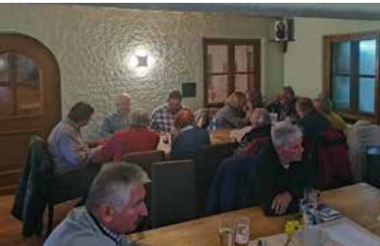
Unser erster Stammtisch nach langer Zeit beim Hahnei Huaba in Ainring.

Ach ja, so ganz nebenbei fällt mir noch ein, im Mai hatten wir ja noch bei unserer Jahreshaupt-